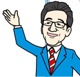
連携中枢都市 札幌市長 秋元 克広