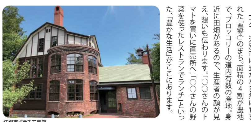
江別市ガラス工芸館

札幌市に隣接する江別市は、J・R札幌駅まで約20分の距離。札幌市のベッドタウンであり、利便性が高いので転入される方も多く、人口は道内7番目の都市となりました。 また、江別市は高校が5校、大学が4校ある文教都市でもあり、小学校1年生からの外国語教育や、小中学校全学級で電子黒板を活用するなど、教育環境が充実しています。 一方で、江別市は豊かな自然に育まれた農業のまち。面積の4割が農地で、プロッコリーの道内有数の産地。身近に田畑があるので、生産者の顔が見え、想いも伝わります。「○○さんのトマトを買いに直売所へ」「○○さんの野菜を使ったレストランでランチ」といった、豊かな生活がここにあります。