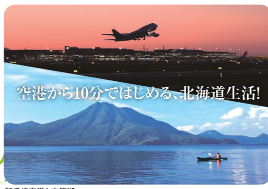
新千歳空港と支笏湖

会社は首都圏、自宅は千歳、月に一度の会社も飛行機でラクラク。これまでの仕事は続けたいけれど、北海道での生活も手に入れたい...そんな欲張りな方には、空港があるまちだからこそはじめることができる、千歳での新しい暮らし方を提案します。