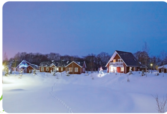
スウェーデンヒルズ

さらに令和4年4月には小中一貫校の「当別町立つべつ学園」が開校しました。脱炭素型校舎をフィールドに独自の教育モデルを取り入れ、「新たな価値を作り上げる力」をそなえた人材の育成を目指していきます。そんな当別町へ、ぜひ一度お越しになってみませんか？