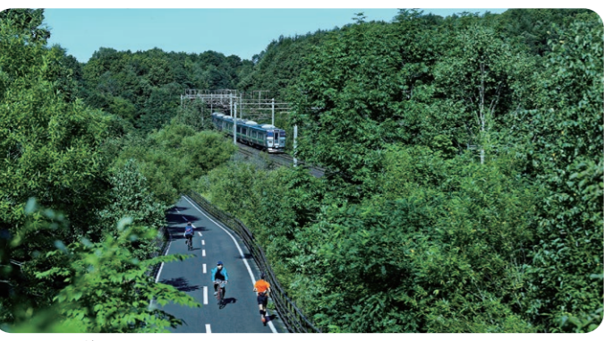
エルフィンロード