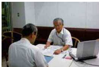
産業支援コーディネーター

また、備後圏域の産業連関表に基づいて作成した経済波及効果測定シートをオープンデータとして公表予定。産業連関表を事業者等が活用することで、圏域内における地域経済活性化に資する事業の創出につなげる。