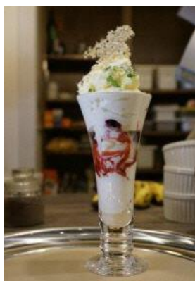
厚真町産ハスカップ を使用したシメパフェ