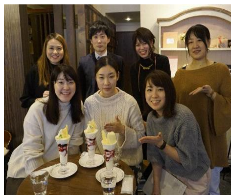
大通女子会とみらい会議