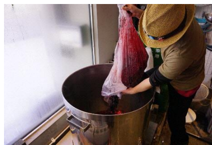
「あつまみらい」の醸造の様子

※IBUとは、International Bitterness Units (国際苦味単位) の略称で、ビールの苦味の程度を測る単位。