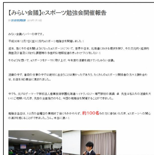
eスポーツ勉強会開催報告ページ