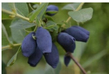
厚真町産ハスカップ

なお、本クラフトビール醸造プロジェクトをきっかけに厚真町からは、「北海道ビアトピア」への共催の承諾のほか、厚真町の特産品等を販売する「厚真町ブース」を出店いただくなど、協力体制を構築することができた。