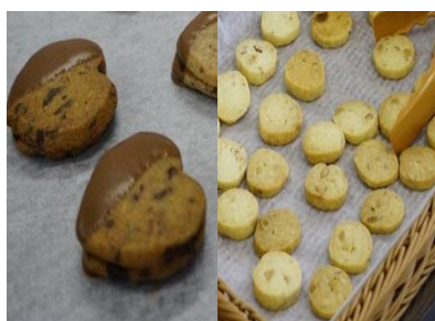
生徒が調理したクッキー