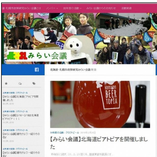
庁内ホームページ トップページ

札幌市庁内職員向けホームページに、「みらい会議」ページ（管理者：まちづくり政策局政策調整課）を開設し、投稿を行う運営チームを編成（2名）。各取組内容、開催報告、メンバー紹介を投稿したほか、「札幌市庁内向けみらい会議ホームページ（以下、「庁内ホームページ」という。）」上でeスポーツ勉強会のアンケートを実施した。