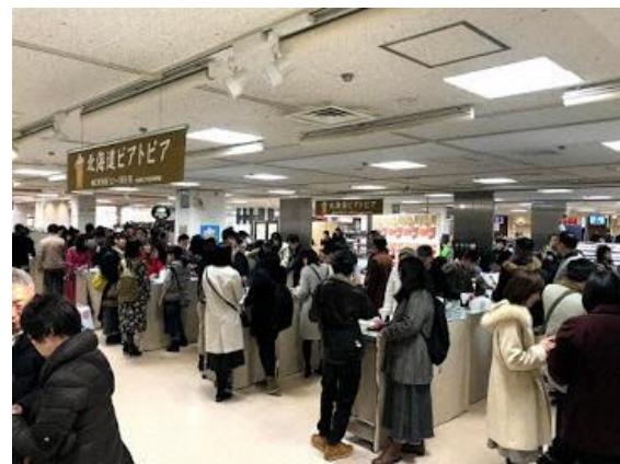
飲食スペースの賑わい