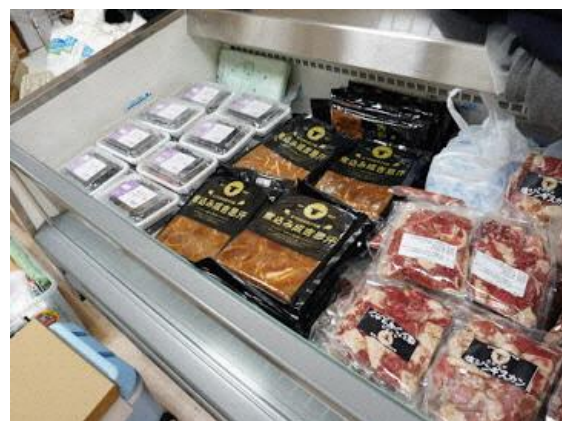
厚真町ブースの物販商品