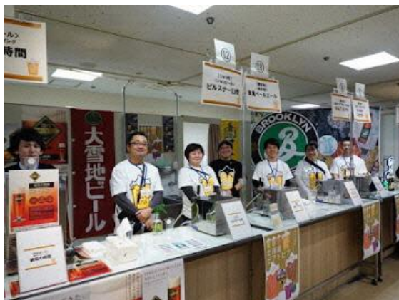
クラフトビールサーブスペース