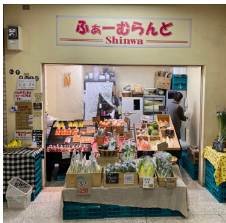
■美園駅「ふぁーむらんど」