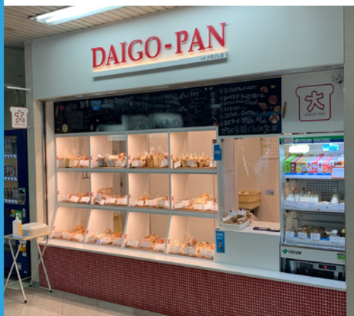
■西18丁目駅「大吾パン」