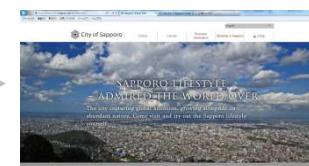
外国語ホームページ