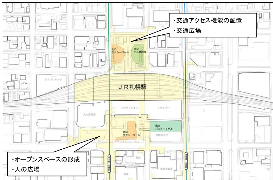
交通施設配置状況