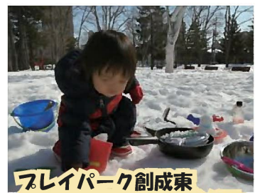
フレイパーク創成東 2021/3/9 (火)@永山記念公園 主催；NPO 法人 E-LINK 協力；一般社団法人さっぽろ下町づくり社