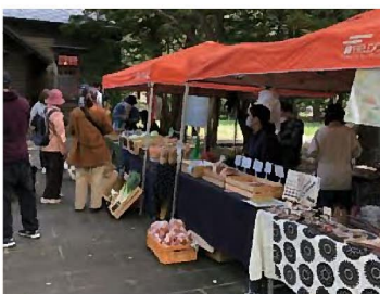
永山マルシェ (永山まつり 2020) 2020/9/26 (土)@旧永山武四郎邸 主催；旧永山武四郎邸指定管理者

コロナ禍にあって、地区祭事、イベント等が実施できない状況ではありましたが、地区関係団体が地区の皆さんの想いに応え、感染予防に十分に配慮しながら、創意工夫を凝らした活動を行いましたので紹介します。