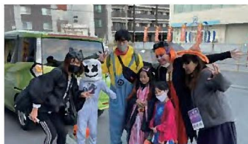
さっぽろで一番あたたかいハロウィン ～創成東であそんじゃおう～ 2020/10/31 (土)@創成東地区/二条市場・サツポロファクトリー周辺 主催；一般社団法人さっぽろ下町づくり社 企画・運営；NPO 法人 E-LINK