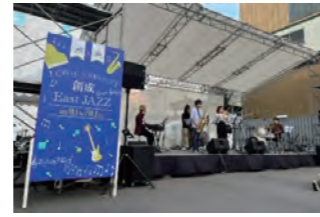
◆創成East JAZZ 令和4年10月1,2日/北海道ガス(株)