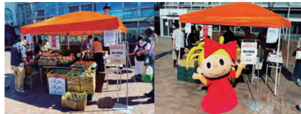
◆創成イーストあおぞらまつり 令和4年9月10,11日/サッポロ不動産開発(株)