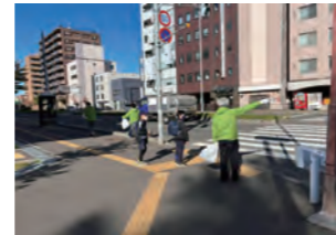
◆見守り清掃活動 令和4年10月～11月/サッポロ不動産開発(株)

一社) さっぽろ下町づくり社がこの度LINEに開設した、まちの情報を掲載する「創成東まちのワ情報局」でも逐次、地区のまちづくりに関する情報を発信していきますので、是非ご登録ください。