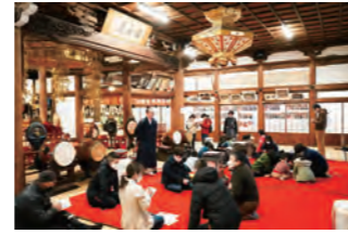
◆地域食堂おかって 令和4年5,7,12月,令和5年1,3月 /NPO法人E-LINK