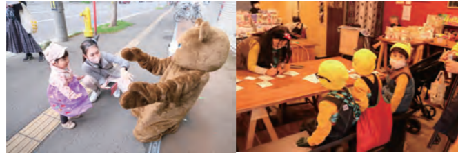
◆第3回さっぽろで1番あたたかいハロウィン～創成東エリアで遊ぼう～ 令和4年10月29日/一般社団法人さっぽろ下町づくり社・NPO法人E-LINK

こうしたまちの魅力を高める活動・取組の輪を広げていくためにも、まちの未来像やまちづくりの指針が盛り込まれたビジョンは、重要となります。