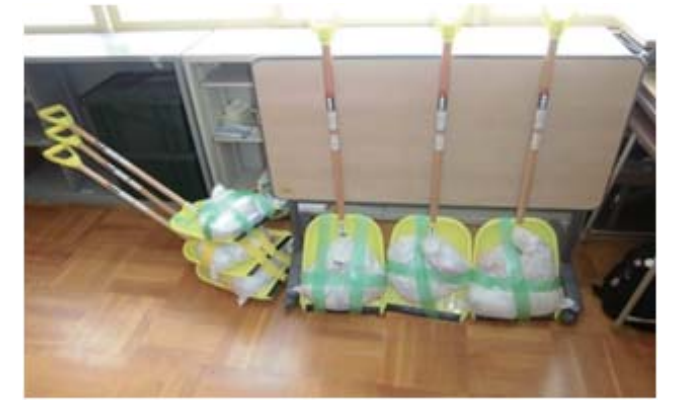
重り(1.5~3kg)を付けた除雪スコップ