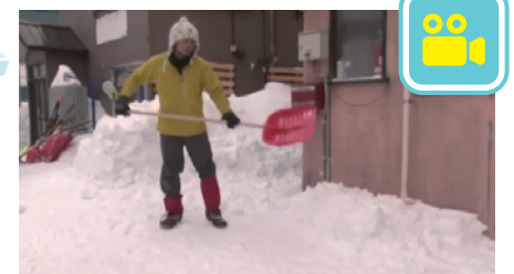
【動画】雪はね(雪ペラ)の使い方(36秒)

※2 積雪地住民の生活機能を評価するため森田ら(2002)が開発したテストで、除雪経験や筋力パワーの差が反映され、北海道各地の高齢者の運動教室実施前後の生活機能の評価表として用いられる。