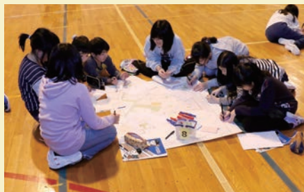
通学路危険場所マップ