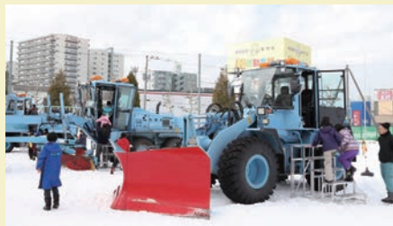
除雪車試乗体験