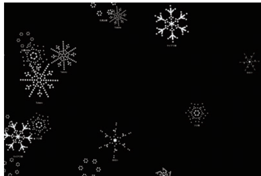
子どもたちがプログラミングでつくった雪の結晶

会期: 2024年1月20日(土)~2月25日(日) 会場: 未来会場(東1丁目劇場施設)など市内6会場 ※一部会場は会期が異なります。