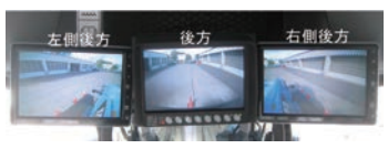
カメラによる後方確認ができる新型除雪グレーダの導入など