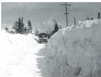
除雪による運行風景