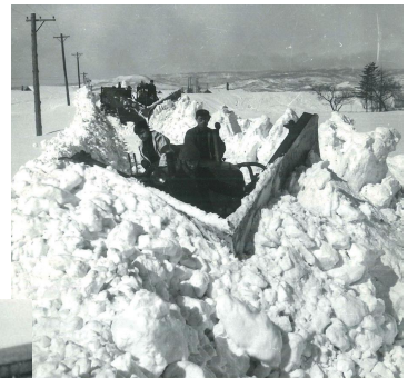
米軍払い下げのアンヒアンバス (六輪全駆動)強力なパワーを生かし、排雪板を装着して除雪にも使った