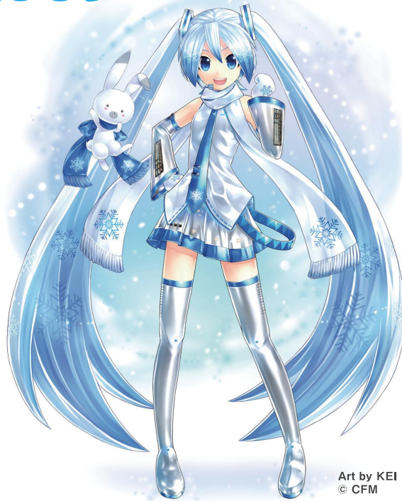
Art by KEI © CFM

世界的にも人気のある「初音ミク」が、北海道を応援するため雪バージョンになったもの。初音ミクを作ったクリプトン・フューチャー・メディア株式会社が札幌市にあることから、さっぽろ雪まつりに雪像として登場したのが雪ミク誕生のきっかけです。2010年の登場から毎年、「雪」や「冬」をモチーフとした衣装を身に付け、北海道や札幌市の冬の生活を盛り上げています。