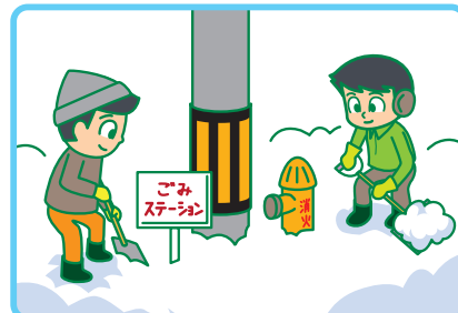
消火栓やごみステーション 周辺の除雪