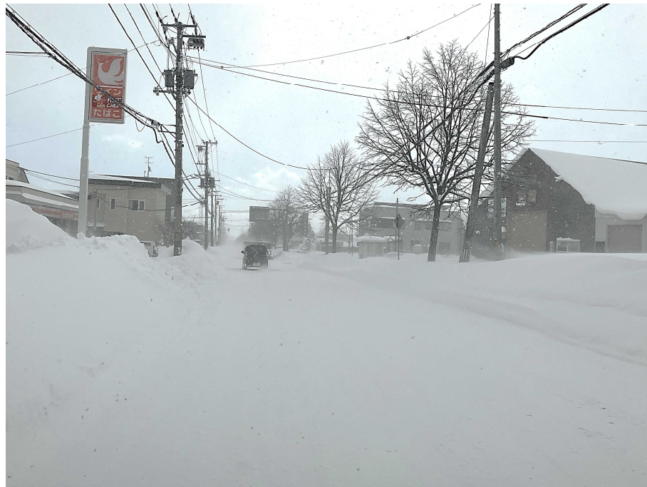
福移沼端線（東区中沼）