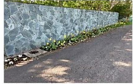
チューリップ・パンジー等