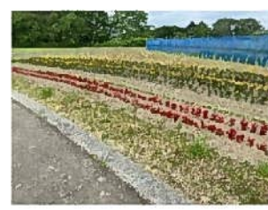
コキア・マリーゴールド等