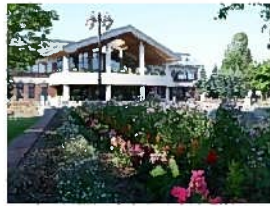
ローダンセ・キンギョソウ・カスミソウ等