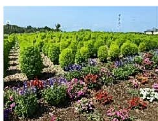
コキア・ペゴニア等