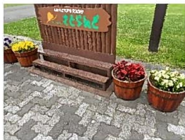
ペゴニア・マリーゴールド等