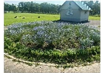
アマ・ペゴニア・ケイトウ・ネモフィラ等