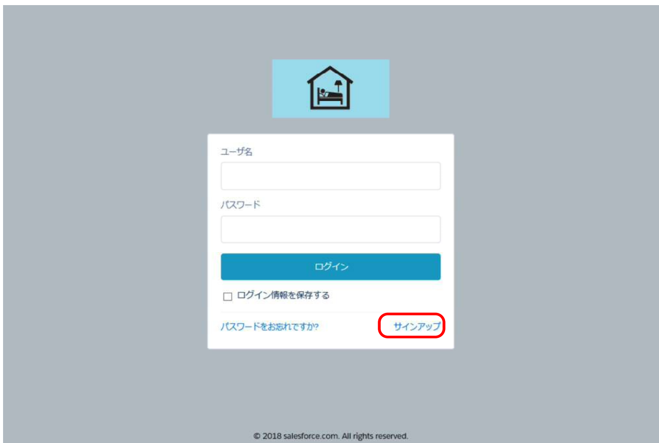
図 3-1 『ログイン』画面