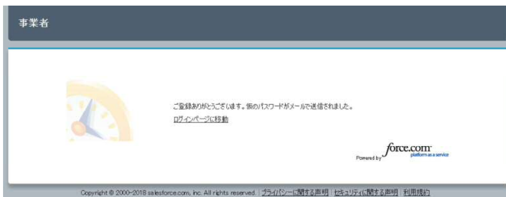
図 3-5 アカウント作成（仮登録完了）