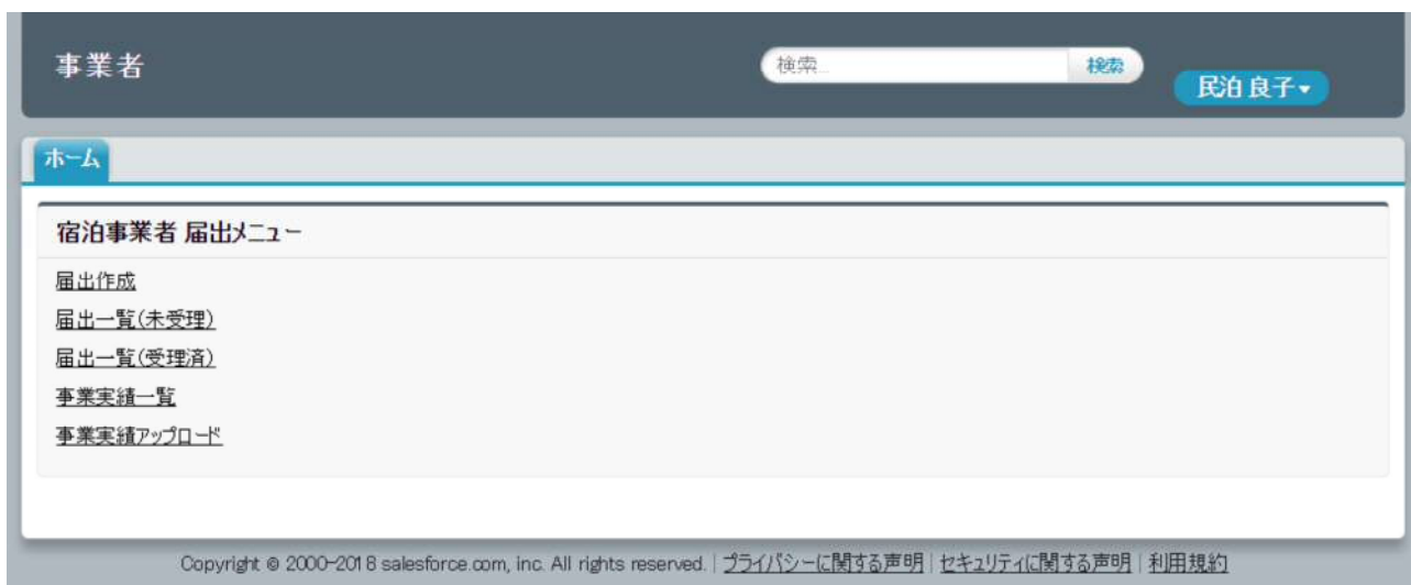
図 3-7 『ホーム』画面