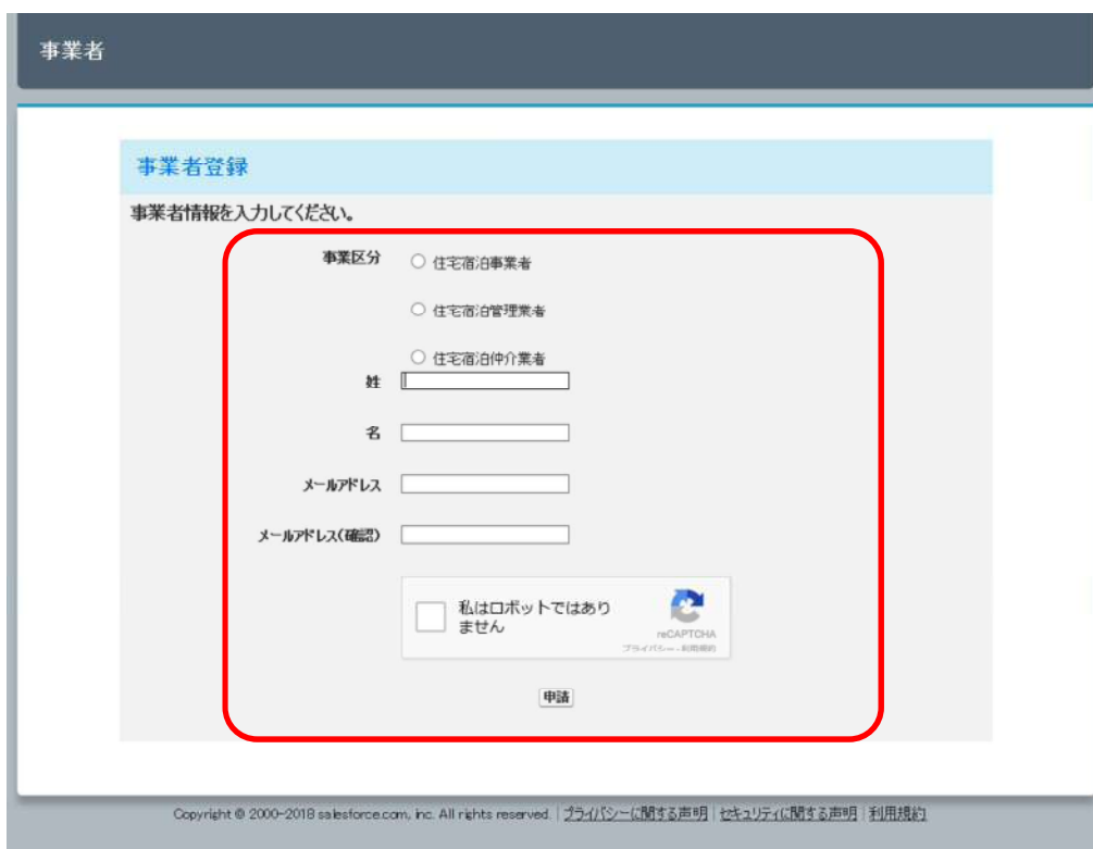
図 3-3 アカウント作成（事業者登録）