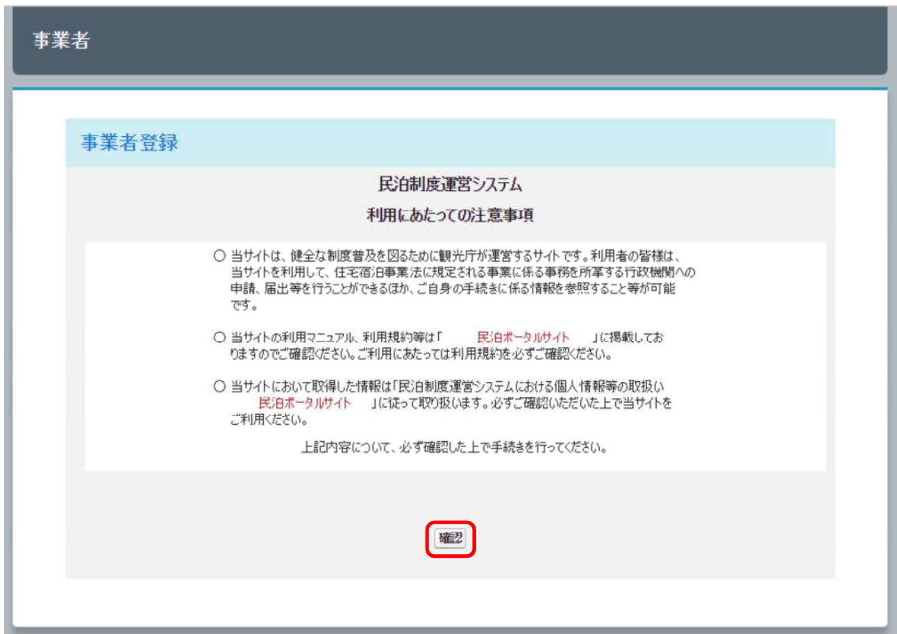
図 3-2 アカウント作成（注意事項）