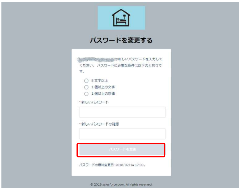
図 3-6 アカウント作成 (パスワード変更)