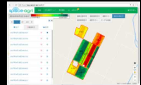
生育マップを高頻度配信

大規模農業生産者の関係者が幸 せになれる、持続可能で、楽し く面白い世界を目指し、イノ ベーションを起こそう