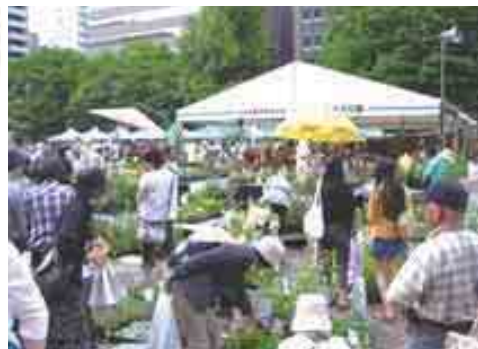
▲昨年度の「花フェスタ 2009 札幌」の様子