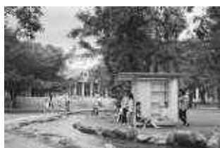
(上) 北海道大学敷地内 (下) 札幌駅前通地下歩行空間での使用シーン