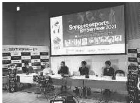
札幌 e スポーツ × ビズセミナー2021

セミナーは、新型コロナウイルス感染症拡大防止のため、YouTube 配信によるオンライン開催となりましたが、「e スポーツ = ゲーム」という図式ではなく、地域 DX 戦略につながる若手人材の育成や地域活性化をゴールとした議論が展開され、多くの視聴者を集めました。