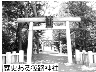
歴史ある篠路神社