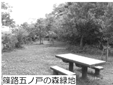
篠路五ノ戸の森緑地