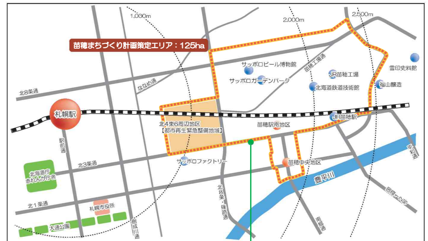
苗穂駅周辺地区まちづくり計画の策定範囲

まちづくり計画の策定範囲は、サッポロガーデンパーク、北4東6周辺地区、苗穂駅南地区など、現在のまちづくりの取り組みを踏まえて、また、まちの様々な資源を活かしながら、苗穂まちづくりを具体的に推進することができるエリアとして上図の範囲を対象とし、その策定エリア面積は125haとしました。