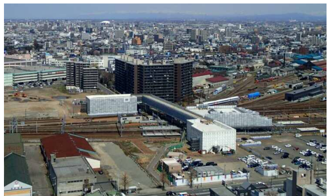
■工事状況写真(H30.4 南口側) 工事のため仮囲いが設置してあります