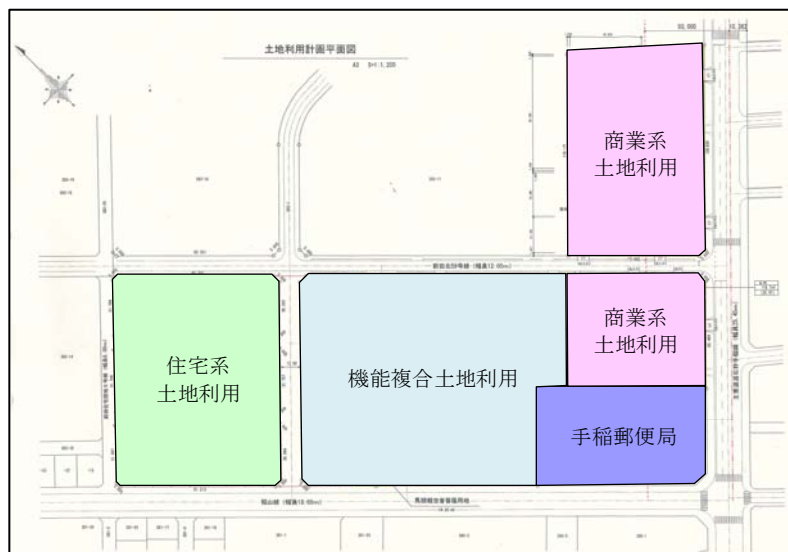
図2 土地利用計画図