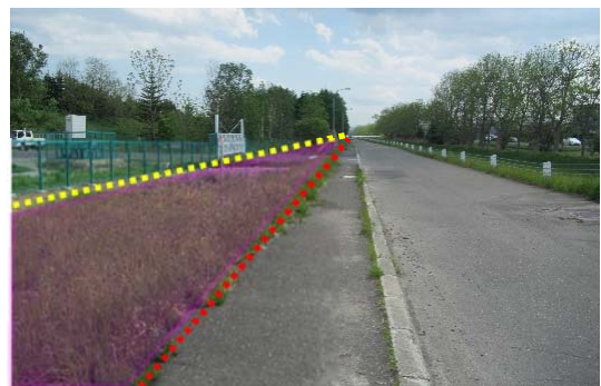
写真 エリア③：山本東線より計画地を南に望む