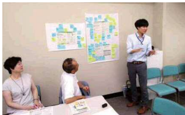
図 実践者ワークショップの様子