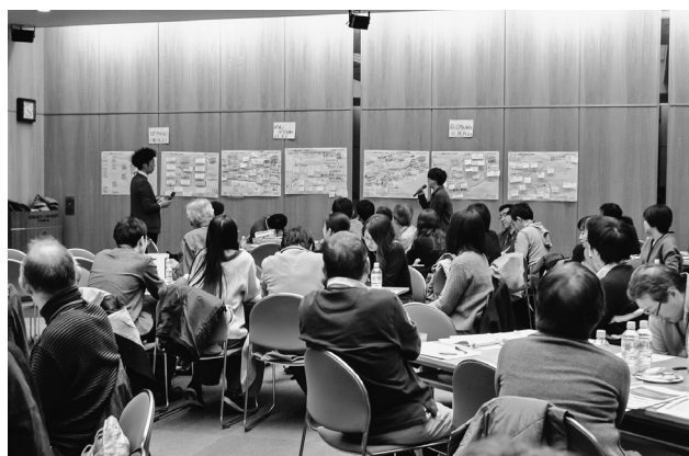
図11 市民ワークショップの様子