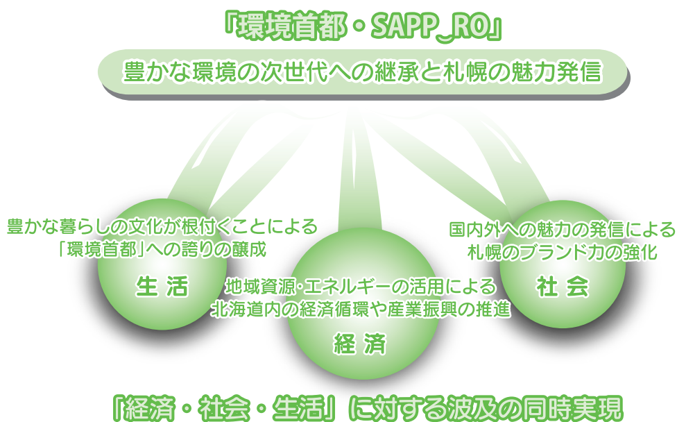
図12 施策の推進による波及効果

将来像の実現に向けて様々な環境施策を積極的に推進することで、豊かな環境を次世代に引き継ぐと同時に、将来像で描く「豊かな暮らしの文化」が根付くことによる、「環境首都」としての誇りの醸成や、「国内外へ魅力を発信」することによる札幌のブランド力の強化、そして「エネルギーや製品の地産地消」による北海道内の経済循環など、「生活」や「社会」、そして「経済」分野における効果を同時に実現した、笑顔で暮らせる持続可能な都市を目指します。