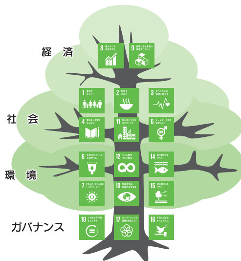
環境、経済、社会を三層構造で示した木の図

資料：環境省環境研究総合推進費戦略研究プロジェクト「持続可能な開発目標とガバナンスに関する総合的研究」より環境省作成