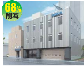
株式会社アクアジオテクノ (株式会社若見田設計)