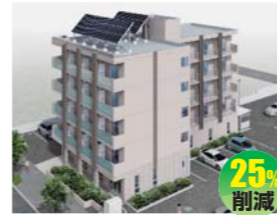
株式会社中山組 (有限会社ジャム建築)