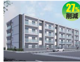
北電興業株式会社 (株式会社札幌日総建)