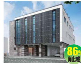
東邦電気工業株式会社北海道支店 (スギオラボ株式会社)