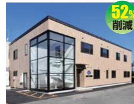
北海道中央バス株式会社 (株式会社泰進建設建築設計事務所)