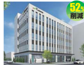
北電興業株式会社 (株式会社アクティ建築設計)