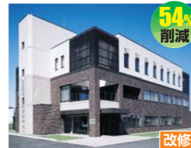
公益財団法人北海道科学技術総合振興センター (トータル・エネルギー・プラン株式会社)