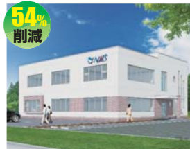
日本動物特殊診断株式会社 (株式会社有我工業所)