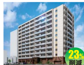
ミサワホーム株式会社 (ミサワホーム北海道株式会社)