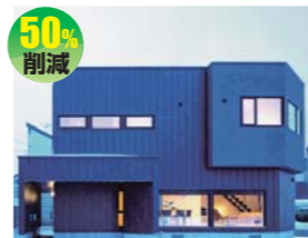
株式会社北王 (ヒノデザインアソシエイツ)