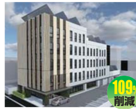
株式会社池田企画 (伊藤組土建株式会社)