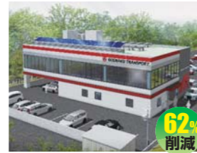
北海道コカ・コーラボトリング株式会社 (戸田建設株式会社札幌支店)