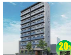
株式会社ティ・エイ・シー・ティ (株式会社宮川建設一級建築士事務所)