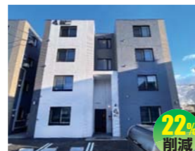
大和ハウス工業株式会社北海道支店 (有限会社ジャム建築)