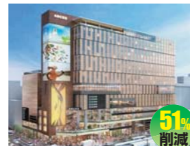
東急不動産株式会社 (北電総合設計株式会社)