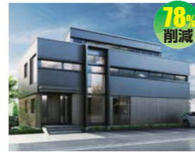
株式会社シーテック (株式会社遠藤建築アトリエ)