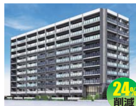
株式会社クリーンリバー (株式会社企画設計事務所オルト)