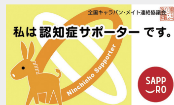
認知症サポーターカード

認知症について正しく理解し、偏見を持たず、認知症の方やご家族の応援者となる「認知症サポーター」を養成する講座です。