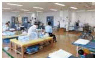
図-2 理学療法室 3F