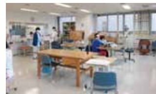
図-3 作業療法室 2F