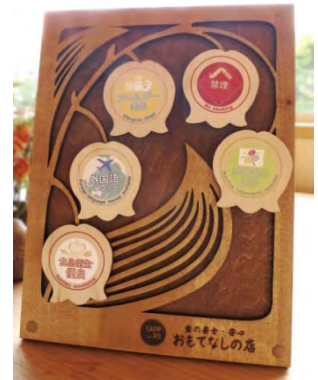
オリジナル啓発ボード

平成27年度（2015年度）より登録を開始し、令和3年度末までの登録数は162店舗（累計）です。