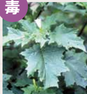
チョウセンアサガオ