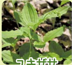
ユキガサ (アズキナ)