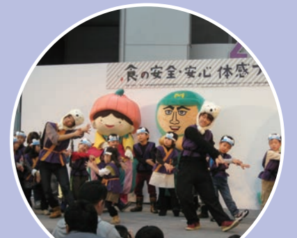
「しろくま忍者の手あらいソング」お披露目の様子(平成24年1月)

子どもたちに楽しんで手洗いの習慣を身につけてもらうため、オリジナルの「 しろくま忍者の手あらいソング 」を作成しました。 曲やダンスの作成は、保育士・栄養士の職員と協同で行いました。