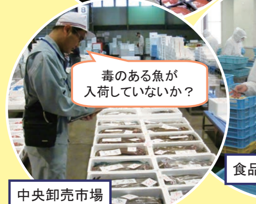
毒のある魚が入荷していないか？