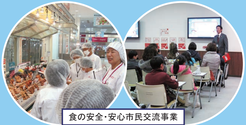
食の安全・安心市民交流事業

営業者の皆さんの「食の安全・安心」に関する自主的な取組を、札幌市との協定として消費者の皆さんにお知らせしています。