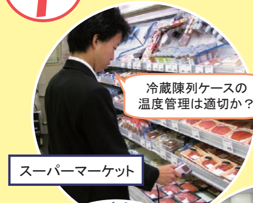
冷蔵陳列ケースの温度管理は適切か？