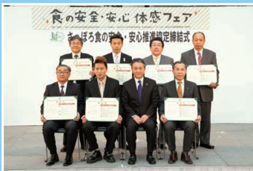
食の安全・安心推進協定 締結式