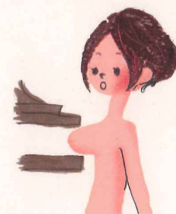
5秒くらい、じっとして…撮影終了！