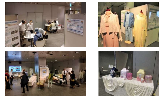
〔チ・カ・ホでのパネル展の様子〕