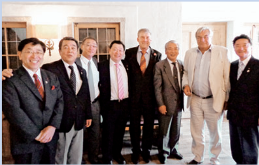
▲記念式典にて、ミュンヘン市議会議員とともに