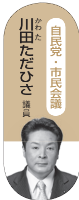
自民党・市民会議