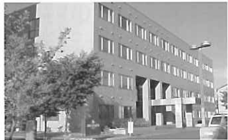
▲平成18年に市立大学に移行予定の札幌市立保健看護学院

問 今年4月1日に移行された地方自治行政法人化により、本市の設置計画、運営形態として公立大学法人制度を導入する予定は可能か。 答 本市の制度のメニューとして、業教育の高い水準を必要とし、産学連携など地域貢献に取組む必要があるなど地域貢献に取組む必要がある。市立大学の設置、運営形態としては、公立大学法人制度を導入するべきであると考え、いかなる。