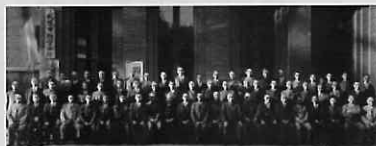
▲第6期市会議員 観音下、札幌市防空本部が置かれた庁舎前で撮影

昭和17年10月3日、昭和22年1月29日・定数44名 大正11年の市会開設以来、昭和22年に地方自治法が施行されて市議会に改称するまで、市会は176回開会されました。