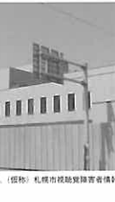
▲旧文化センターの跡地は、(仮称)札幌市視覚障害者情報文化センターとして整備される

問 現在、活動している札幌市視覚障害者情報文化センターは、札幌市視覚障害者情報文化センターとして整備されるのか。