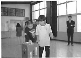
▲平成15年10月22日、森井江村で実施された子ども投票

問 子どもたちの権利条例に規定している権利をどう実現していくか。 答 子どもたちの権利条例に規定している権利をどう実現していくか。