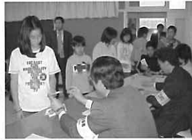
▲平成15年10月22日、森井江村で実施された子ども投票