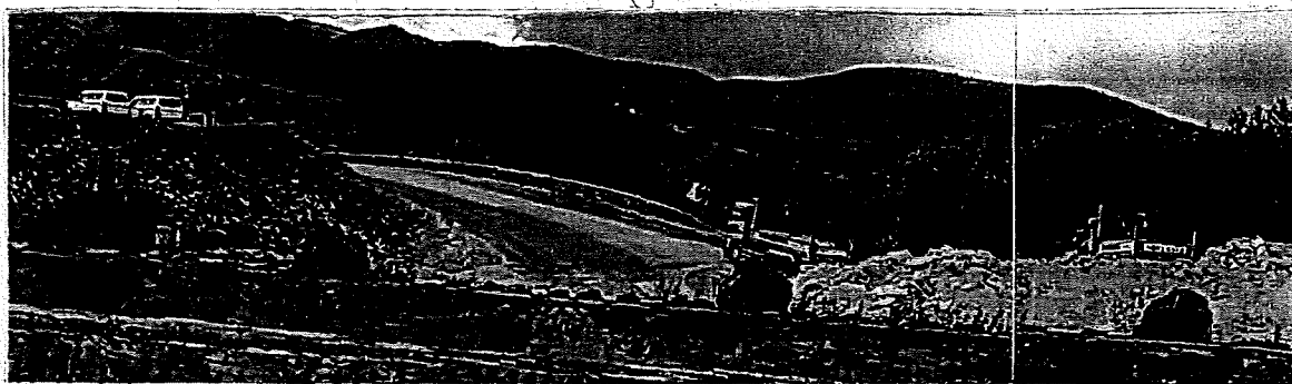
■ 【写真説明】 山口処理場の搬入現場の情景 (ドリームビーチへの道路上の車両出入口から陳情者撮影) 2023.09.05

※ 左側の黒褐色の土は重金属をふくむ対策土。写真の右半分のダンプの下の白い土が、ヒ素を含む土。