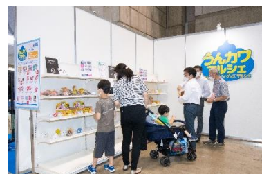
(うんカワマルシェ ['22 東京])