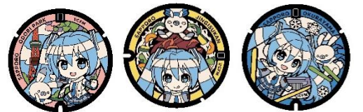
大通公園 すすきの交差点 大倉山ジャンプ競技場